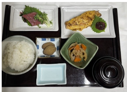
昼和定食 (鮭ウニ焼き・お刺身・長芋とんぶり) 1日20食限定 1,430 円