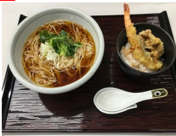
手打ちそばセット (ミニ天丼付き) 稲庭うどんセット (ミニ天丼付き) 1,430 円