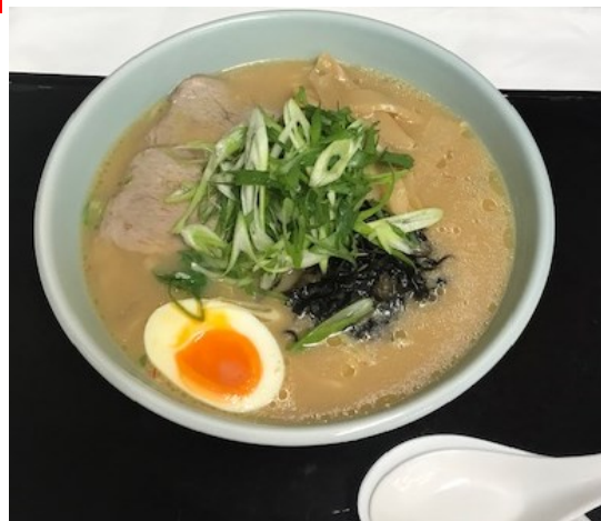
とんこつ味噌ラーメン 1,380 円