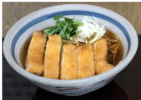
温・冷とんかつそば 1,320 円