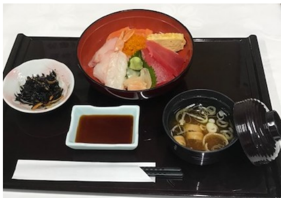
海鮮丼 (味噌汁・小鉢) 1日20食限定 1,870 円